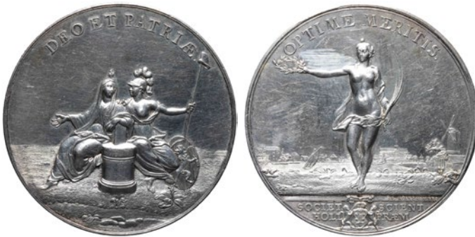
Figuur 3. Voor- en achterzijde van de penning. (Nationale Numismatische Collectie, PE-13279)

Op de voorzijde van den eerpenning ziet men de Godsdienst, leunende met de linkerhand op den Bijbel, die op een Altaar staat; naast haar zit het Vaderland, onder het beeld van Minerva, hebbende de speer, waarop de vrijheidshoed, in hare handen, en het wapen van Holland aan hare voeten, met het omschrift: Deo et Patriae . De keerzijde vertoont de Waarheid, met een lauwerkrans in de regter, en een' palmtak in de linkerhand, in 't verschiep ziet men Haarlem; het omschrift is: Optime Meritis . 10