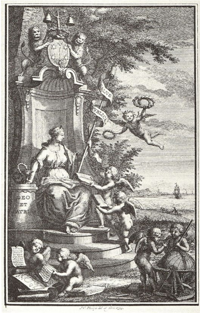
Figuur 4. Gravure in het eerste deel van de Verhandelingen (1754). (Bierens de Haan 1952, 182)