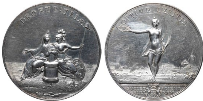
Figuur 3. Voor- en achterzijde van de penning. (Nationale Numismatische Collectie, PE-13279)

Op de voorzijde van den eerpenning ziet men de Godsdienst, leunende met de linkerhand op den Bijbel, die op een Altaar staat; naast haar zit het Vaderland, onder het beeld van Minerva, hebbende de speer, waarop de vrijheidshoed, in hare handen, en het wapen van Holland aan hare voeten, met het omschrift: Deo et Patriae . De keerzijde vertoont de Waarheid, met een lauwerkrans in de regter, en een' palmtak in de linkerhand, in 't verschiet ziet men Haarlem; het omschrift is: Optime Meritis . 10