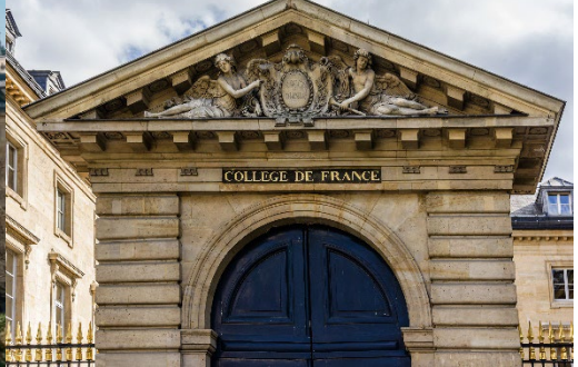
COLLEGE DE FRANCE