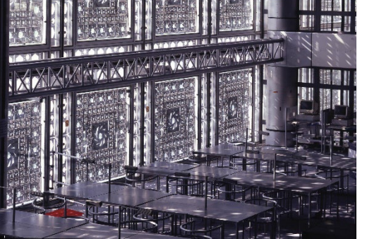
INSTITUT DU MONDE ARABE